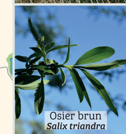
Osier brun Salix triandra