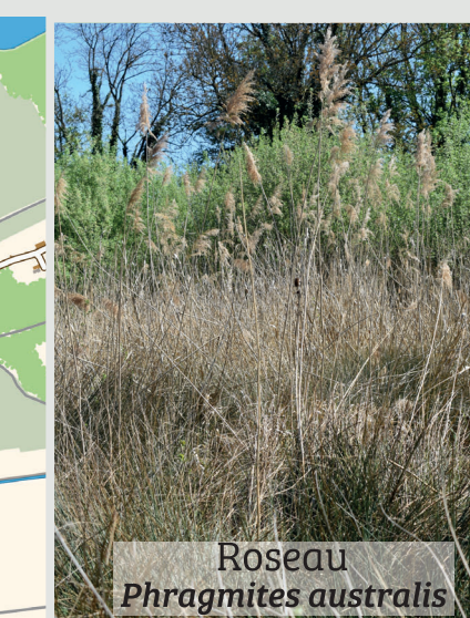
Roseau Phragmites australis