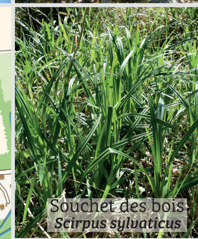
Souchet des bois Scirpus sylvaticus