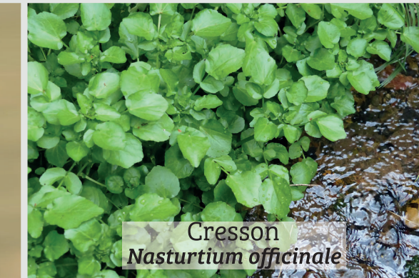
Cresson Nasturtium officinale