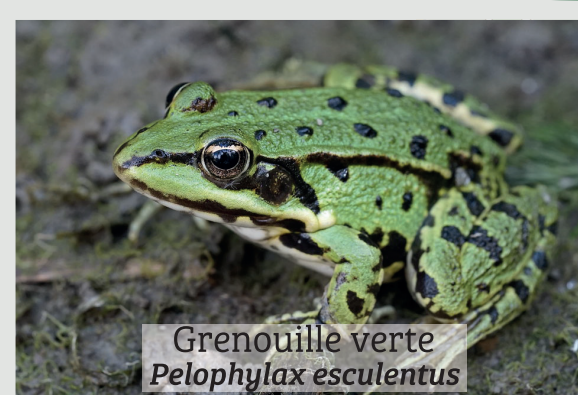
Grenouille verte Pelophylax esculentus