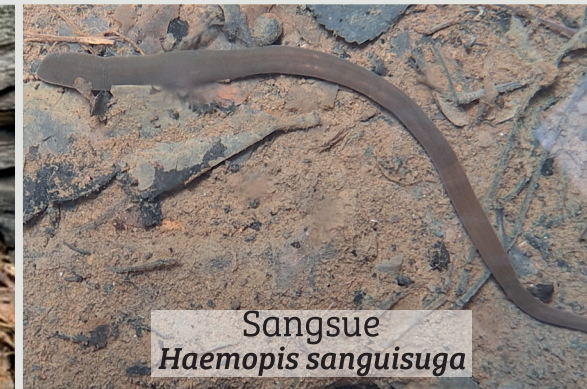
Sangsue Haemopsis sanguisuga