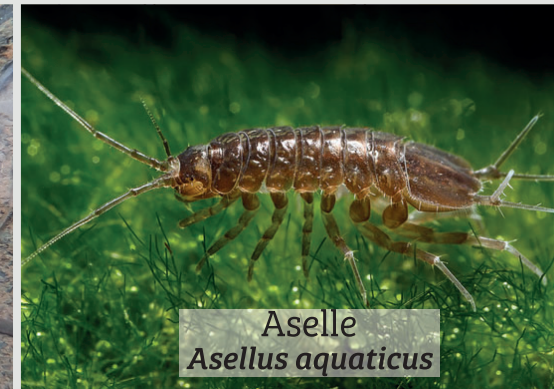
Aselle Asellus aquaticus