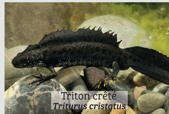
Triton crête Triturus cristatus