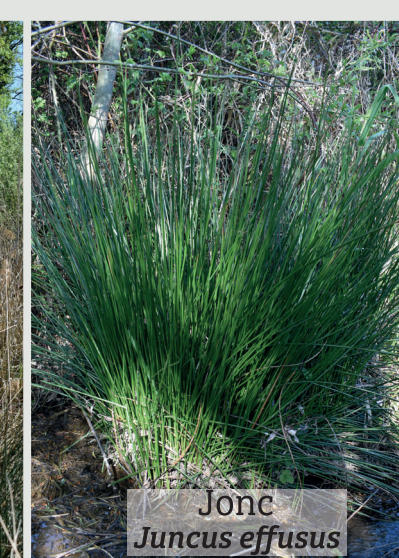
Jonc Juncus effusus