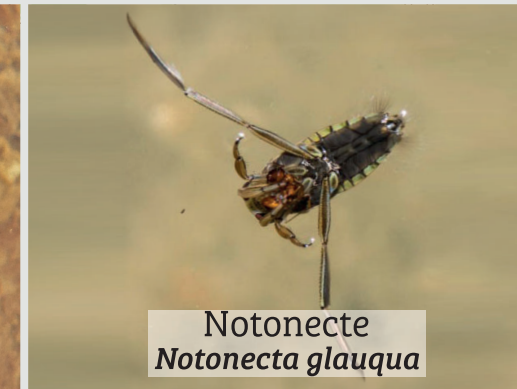
Notonecte Notonecta glauca