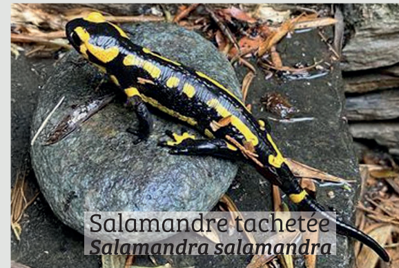
Salamandre tachetée Salamandra salamandra