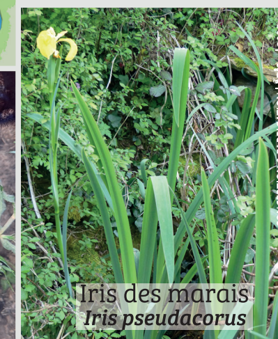
Irises des marais Iris pseudacorus