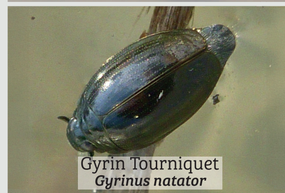
Gyrin Tourniquet Gyrinus natator