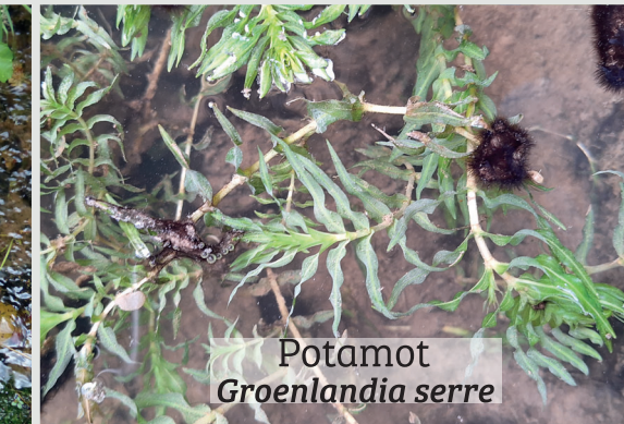
Potamot Groenlandia serre