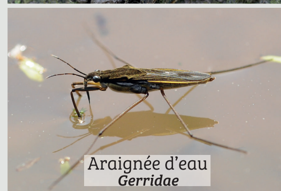
Araignée d'eau Gerridae